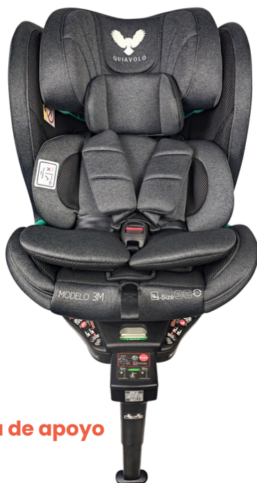
Pata de apoyo

Fundas removibles: completamente extraíbles y lavables, lo que permite un mantenimiento sencillo, manteniendo la silla en óptimas condiciones.